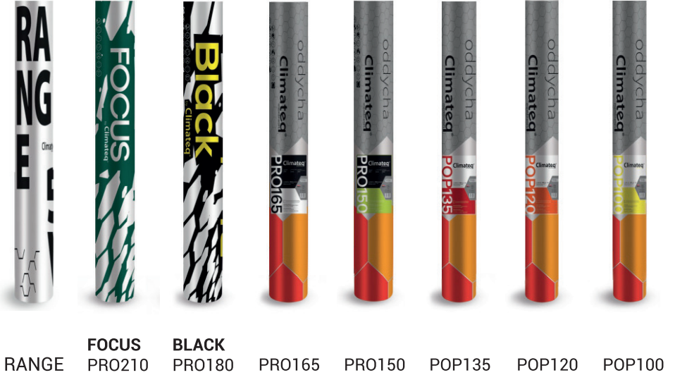
RANGE FOCUS BLACK PRO165 PRO150 POP135 POP120 POP100